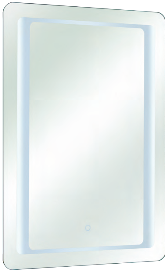
Spiegel 21-I inkl. Touchsensor, 12 V LED, 15 W, 790-1190 Lumen