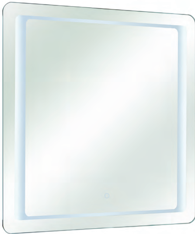
Spiegel 21-II inkl. Touchsensor, 12 V LED, 15 W, 930-1250 Lumen