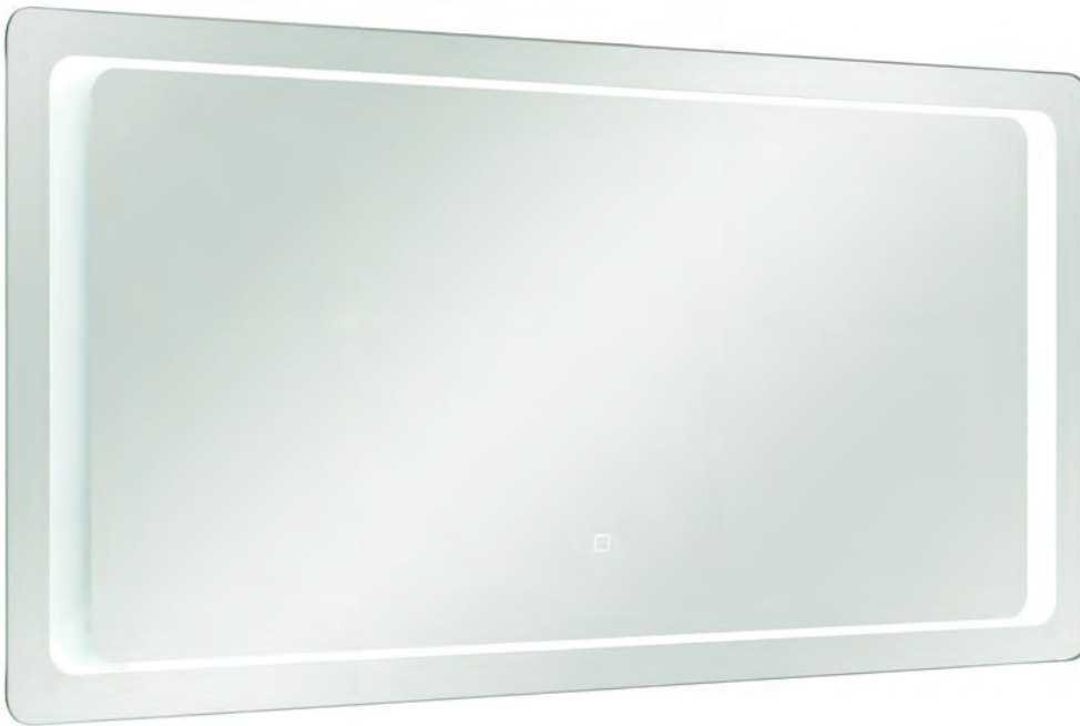
Spiegel 21-V inkl. Touchsensor, 12 V LED, 20 W, 1280-1450 Lumen