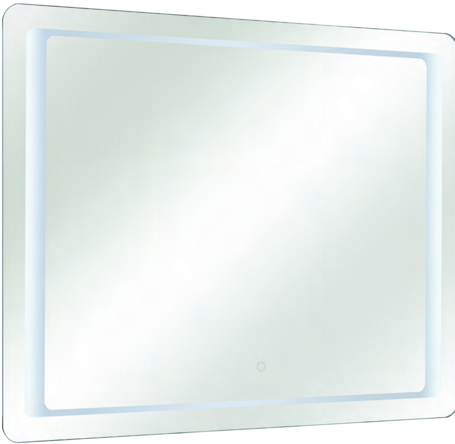
Spiegel 21-III inkl. Touchsensor, 12 V LED, 20 W, 1110-1290 Lumen