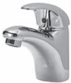
Einhebelmischer Chrom Glanz