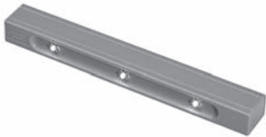
LED-Schubkasteninnenleuchte Bewegungsmelder (Batterien nicht im Lieferumfang enthalten)