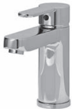
Einhebelmischer Chrom Glanz