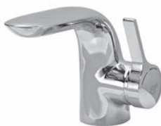
Einhebelmischer Chrom Glanz