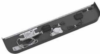
LEDmotion LED-Leuchte mit Bewegungssensor zur Ausleuchtung des Badezimmerbodens im Dunkeln, 12V LED, LM LED, 5W zur Montage unter Möbeln ab 700 mm Breite

Stromanschluss erforderlich! Achtung! Nicht mit LED-Beleuchtungen am Waschtischunterschrank kombinierbar