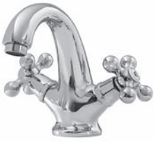
Waschtischarmatur Chrom Glanz