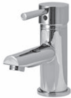
Einhebelmischer Chrom Glanz