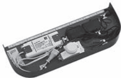
LEDmotion LED-Leuchte mit Bewegungssensor zur Ausleuchtung des Badezimmerbodens im Dunkeln, 12V LED, LM LED, 3W zur Montage unter Möbeln von 400 mm - 699 mm Breite

Stromanschluss erforderlich! Achtung! Nicht mit LED-Beleuchtungen am Waschtischunterschrank kombinierbar