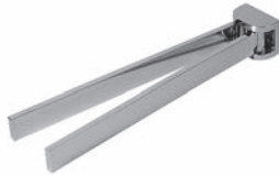
Handtuchhalter Chrom Glanz zur Wandmontage, 2-armig Mindestplatzbedarf: 120 mm