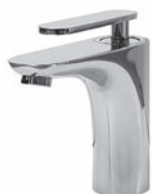
Einhebelmischer Chrom Glanz